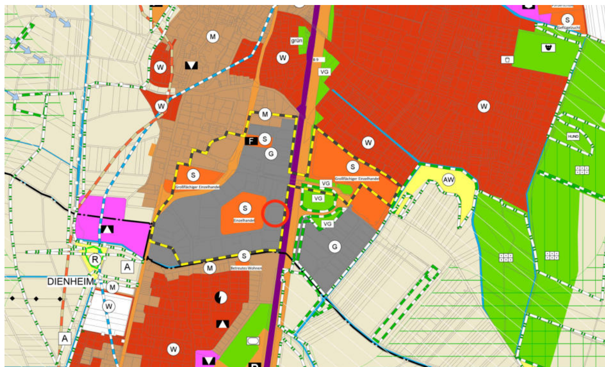
Ausschnitt aus dem rechtswirksamen Flächennutzungsplan 2030 der Verbandsgemeinde Rhein-Selz (einschließlich Landschaftsplan) mit Kennzeichnung der Lage des Geltungsbereiches

Damit liegt die gem. § 1 (4) BauGB mögliche Anpassung an die Ziele der Raumordnung vor.